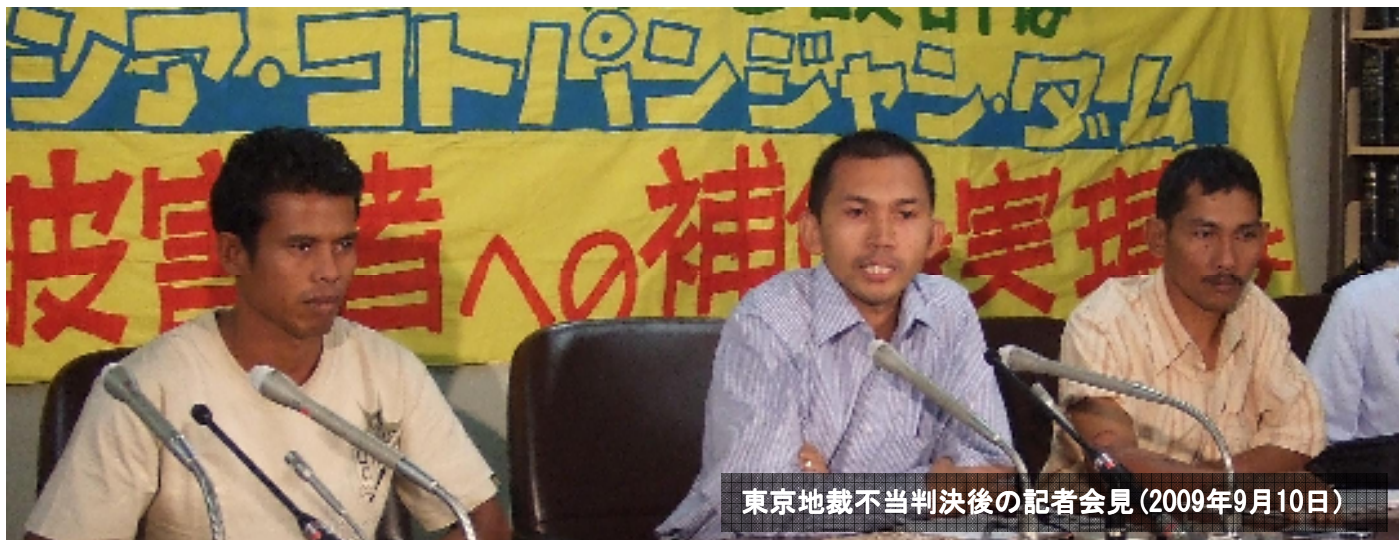
東京地裁不当判決後の記者会見(2009年9月10日)

ミリーが儲けるためだけに建設されたダムです。私たちは、ただただ苦しみを味わっただけです」-住民はこうも語ります。