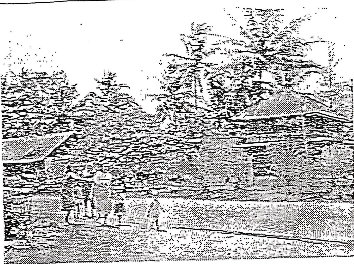
(画)の9の建設予定地、河川を架かる4本の橋を望む。シンパレンガ川に架かる4本の橋は、建設中。